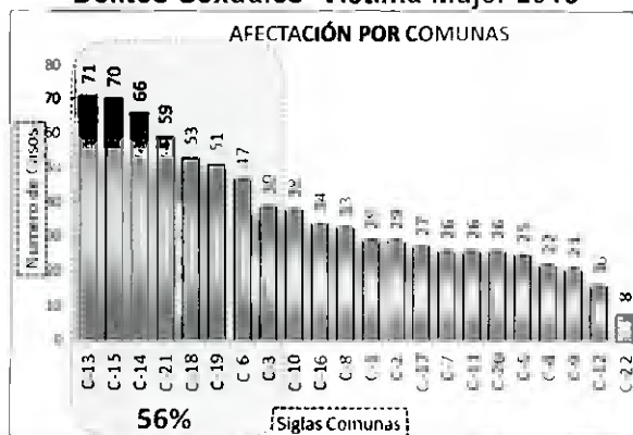
Delitos Sexuales Víctima Mujer 2015

SECRETARÍA DE GOBIERNO, CONVIVENCIA Y SEGURIDAD