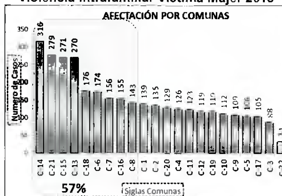
Violencia Intrafamiliar Víctima Mujer 2015