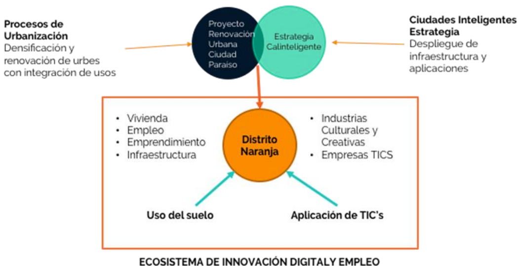
Gráfica 3. Ciudades inteligentes y renovación urbana

En ese sentido, “Ciudad Paraíso” representa una ventaja estratégica para la implementación de las tecnologías al servicio de la oferta cultural y creativa. Siendo una experiencia piloto, posibilitará crear escenarios de innovación digital que viabilice la oportunidad para la reactivación económica de la ciudad a partir de la